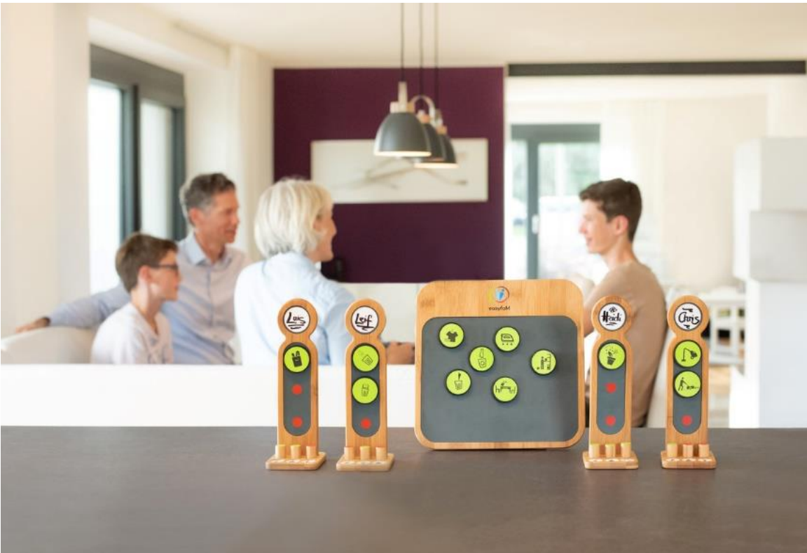
Bildunterschrift: Das easyfaM® Tastboard ist ab November erhältlich.

Bilddatei: easyfaM-Taskboard-1200px.jpg - Serienprodukt