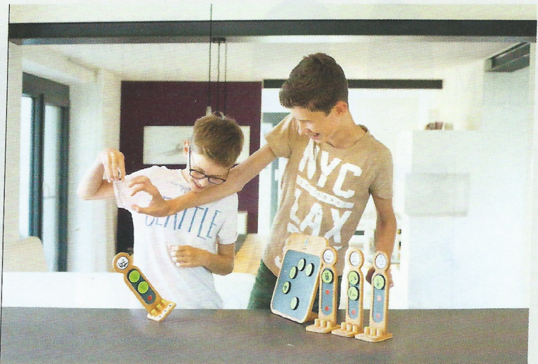
La concurrence ludique des frères et sœurs pour gagner les dernières pièces de tâches ménagères

La famille gagne en temps libre grâce à une communication et une visualisation claires. Comme nous, les enfants n'aiment pas les discussions qui se répètent et préfèrent une cohabitation joyeuse et ludique, permettant de fêter ensemble les résultats. Sans oublier qu'ils apprennent simultanément d'excellentes méthodes de travail, une certaine autonomie et plus de liberté dans la gestion du temps. Des capacités et des valeurs essentielles pour leur avenir.