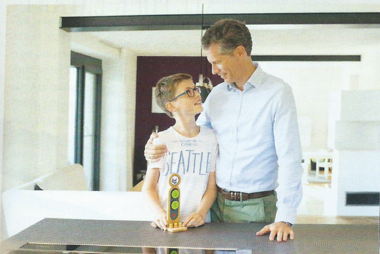
Un grand bravo pour les tâches quotidiennes réalisées